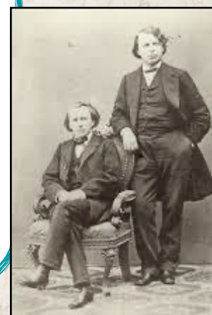
Joseph Joachim und Johannes Brahms